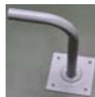
8. Ścienne wspornik mocujący (opcja tylko w modelach ANT0044, ANT0045, ANT0046)