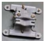
5. Regulowany uchwyt czaszy