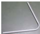
6. Ramię konwertera LNB