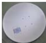
7. Czasza antenowa